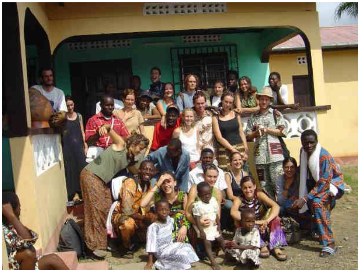
Les volontaires du camp chantier d'Amou-Oblo (août 2004)

L'association Ozia a vu le jour en 2004. Elle rassemble des volontaires partout en France. Ozia mène une action humanitaire en Afrique de l'ouest (Togo, Bénin et Burkina Faso), basée sur le volontariat, essentiellement des étudiants européens bien que le voyage soit ouvert à tous.