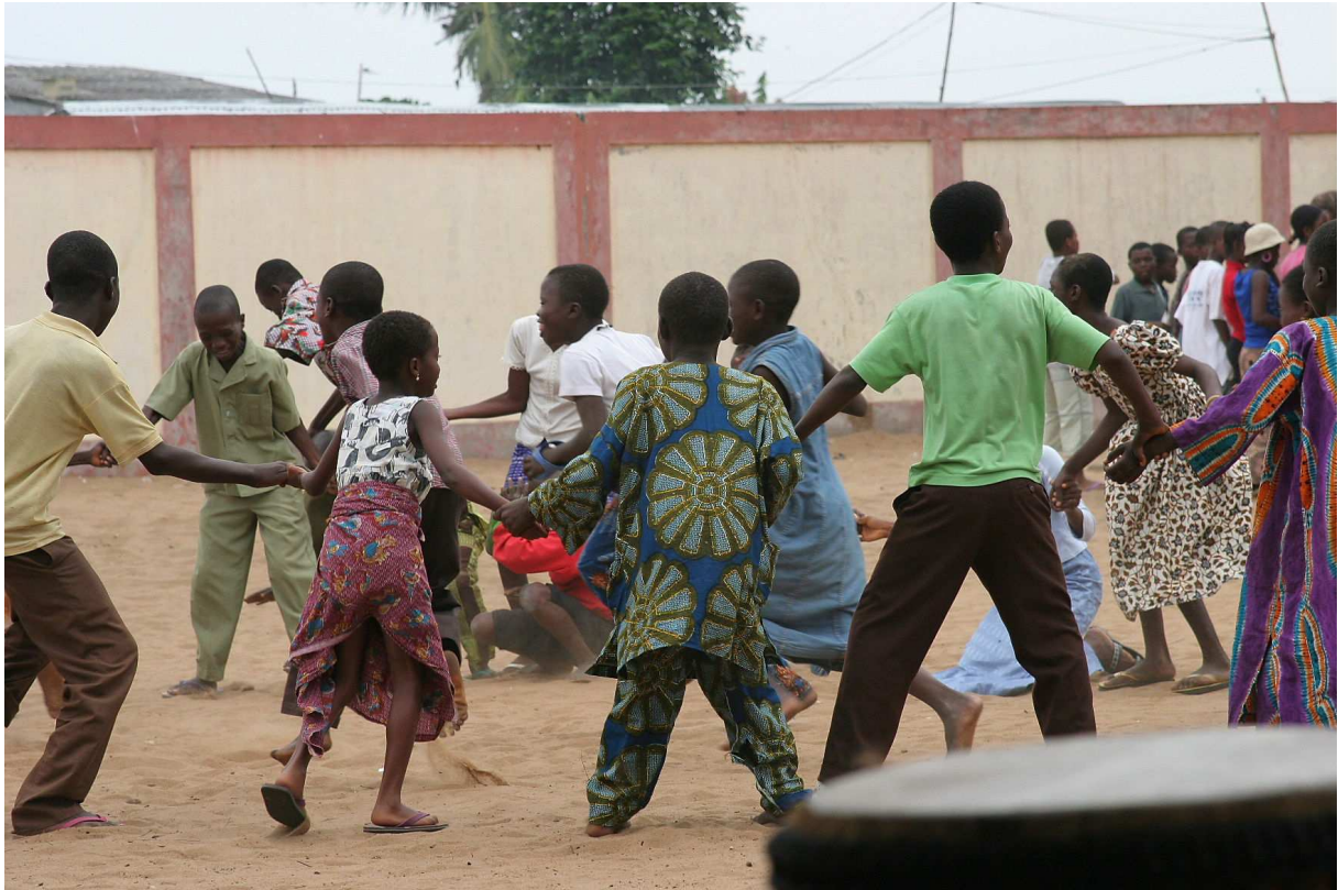
Activités pour les enfants l'après-midi