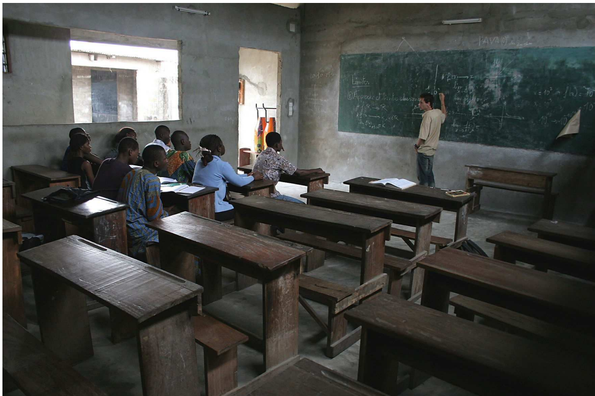
Cours de mathématiques pour les élèves de Terminale

La journée type d'un camp chantier commence par une matinée de cours (8h – 12h), dispensée pour les élèves du primaire au lycée. Les matières enseignées sont prioritairement les mathématiques et le français ; mais grâce aux compétences de chacun, les enseignements peuvent se diversifier : SVT, chimie, philosophie, économie, anglais, chant, cours d'éducation sexuelle (sensibilisation aux IST), etc.