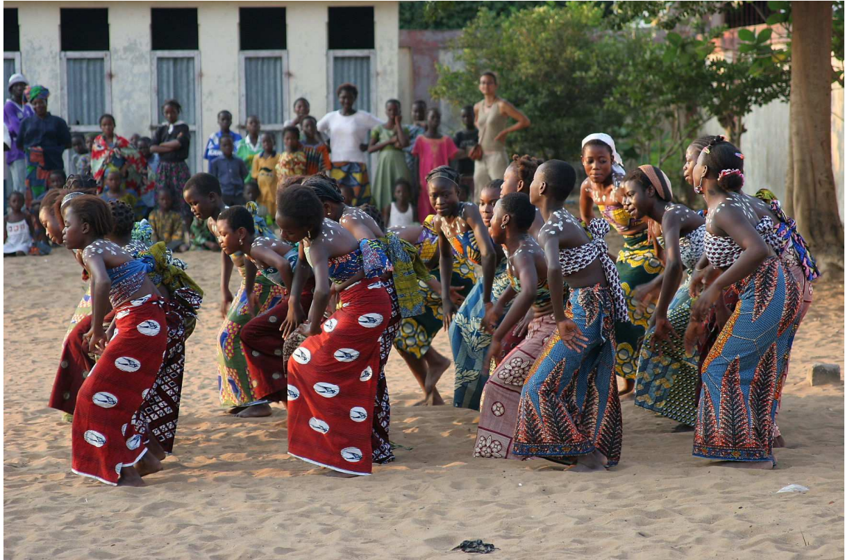
Spectacle de danse lors de la kermesse, par les élèves de 4 ème