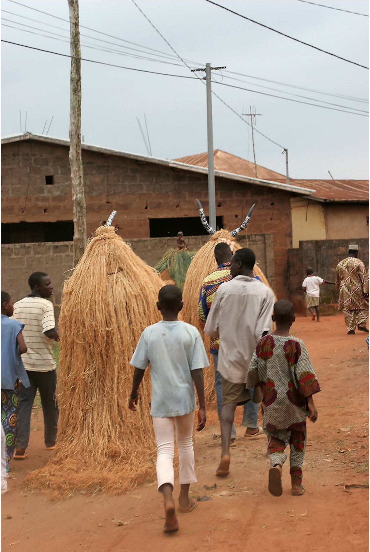
Les maîtres du vaudou: les Revenants et leur escorte