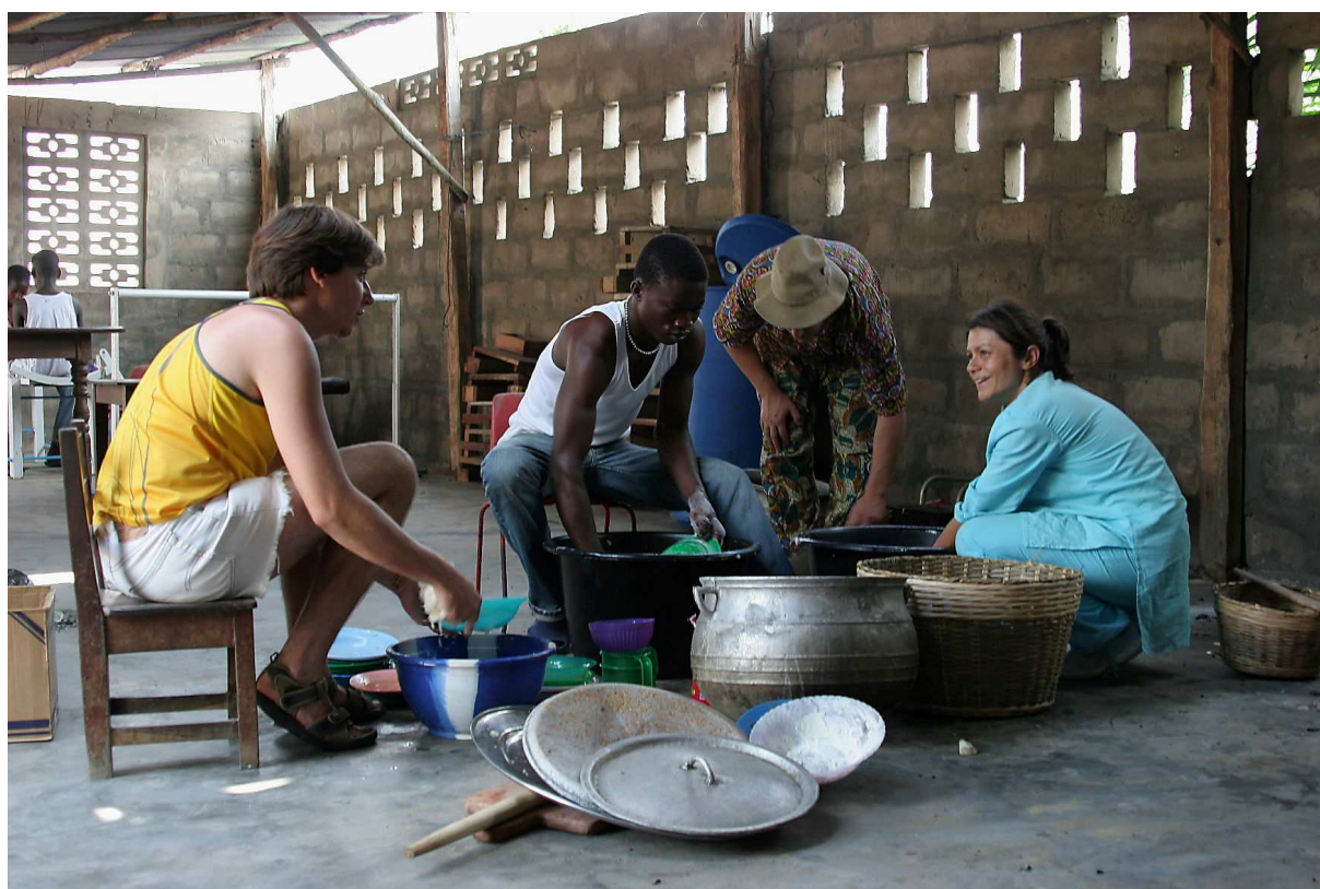
Tour de corvée pour le groupe vaisselle

Précisons que les camps chantiers offrent la possibilité d'apprendre beaucoup sur soi en participant à la vie du groupe (répartition des corvées : vaisselle, cuisine, ménage, etc.) et cela dans un pays étranger, aux coutumes et aux traditions autres, mais aussi au rythme de vie différent.