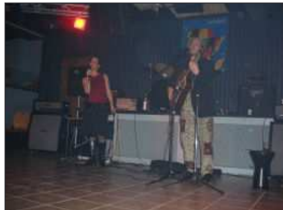
Quelques concerts lyonnaises