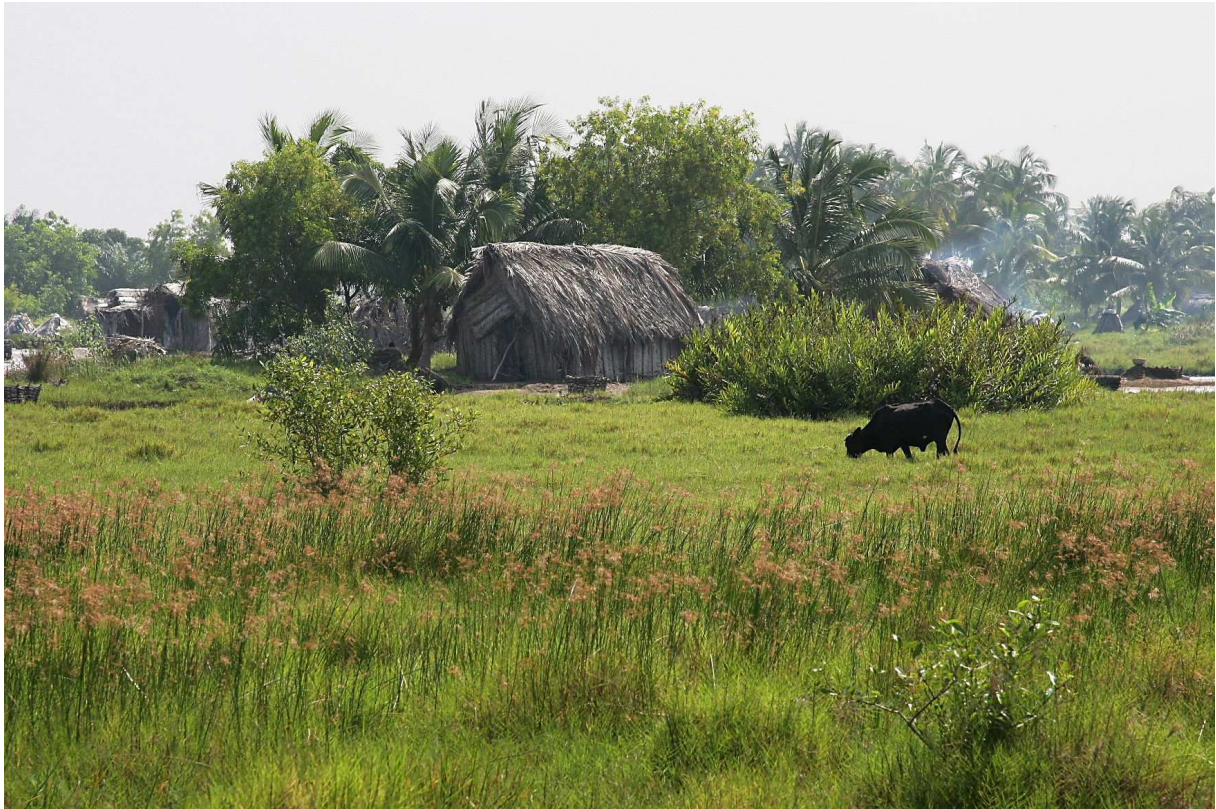
Beauté du paysage béninois

Derrière l'action humanitaire se cache également la découverte d'un pays, aspect plus humain sans doute qu'on ne le pense. Le contact avec les locaux est l'occasion de partir à la découverte de paysages sans tomber dans le piège du tourisme outrancier. Le respect de l'autre et de son milieu de vie contribue à l'échange multiculturel sous l'égide duquel se place notre association.