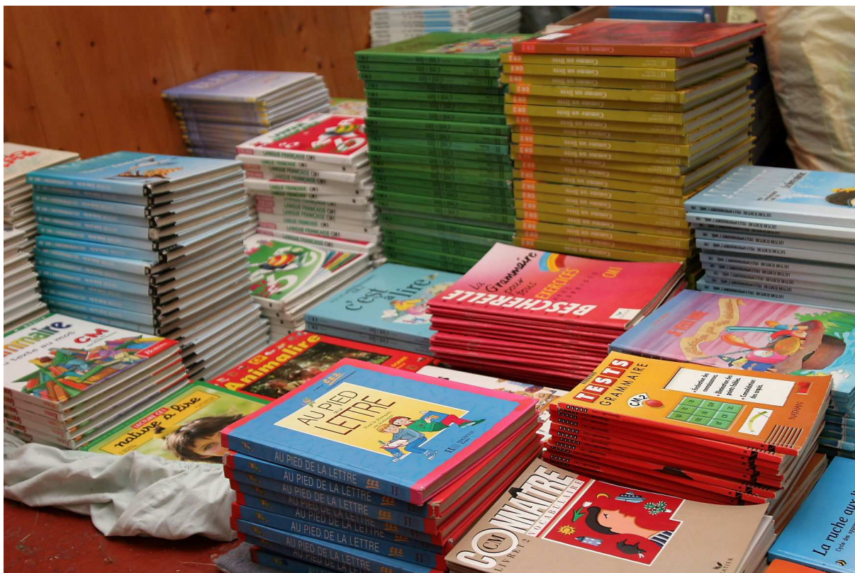
Récolte de matériel pour le camp chantier de Cotonou (juillet - août 2005)

Les voyages se font sur la base du bénévolat ; ainsi, aucune aide extérieure ne vise à rémunérer les volontaires ou à leur offrir le voyage. Les sommes récoltées sont à chaque fois investies dans l'achat de matériel, en France ou en Afrique (cf. nos besoins).